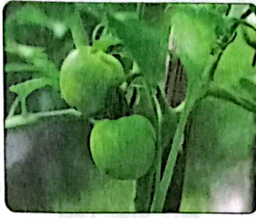
ظهور حبّات الطماطم أولاً خضراء